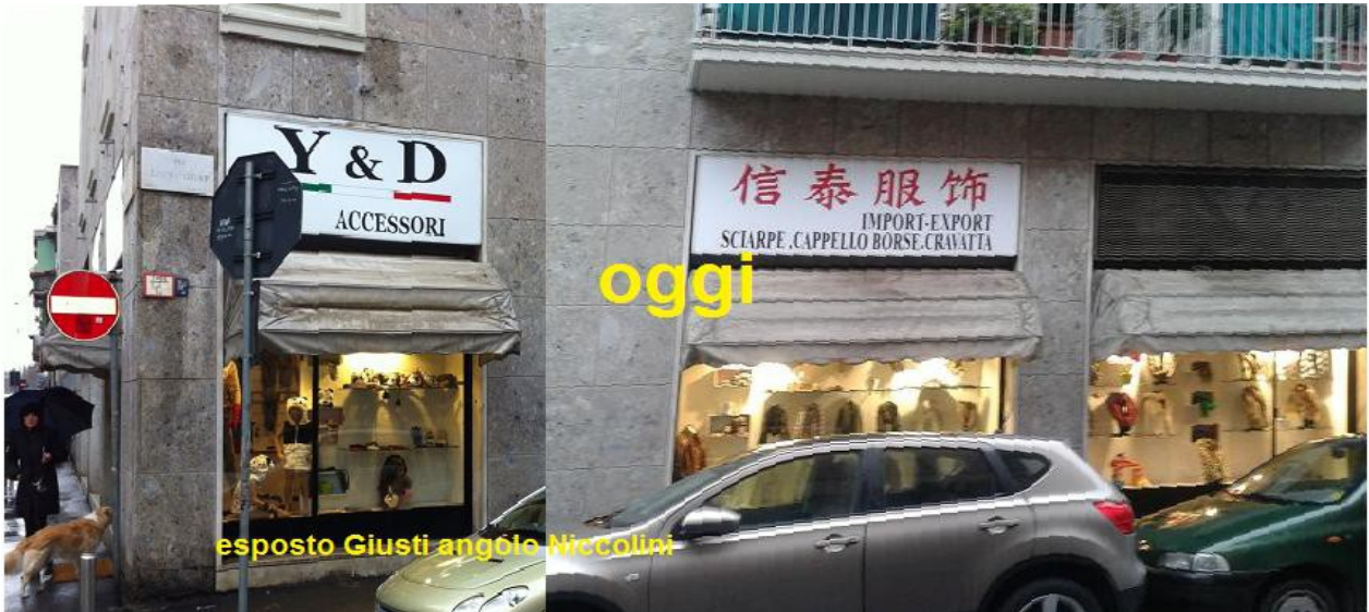
Via Niccolini 10, angolo via Giusti-Milano-Situazione odierna – Ingrosso Y & D