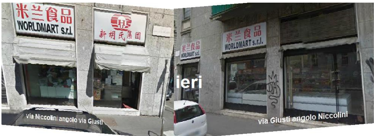
Via Niccolini 10, angolo via Giusti–Milano–Situazione pre-esistente–Supermercato Worldmart

Allegate foto degli esercizi commerciali oggetto degli esposti