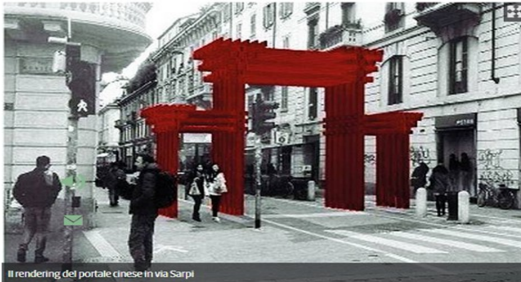
Il rendering del portale cinese in via Sarpi